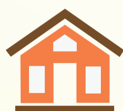
几乎没有空调至完全没有空调的房子