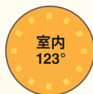
室内 123° 经历时间: 60 分钟