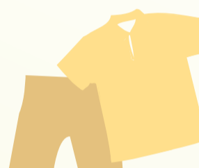
穿轻便，浅色，宽松衣服