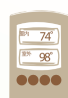
呆在有空调的凉爽区域