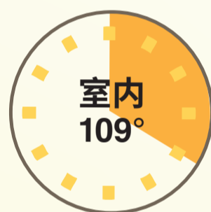
室内 109° 经历时间: 20 分钟