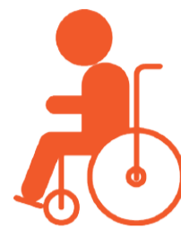
Người khuyết tật