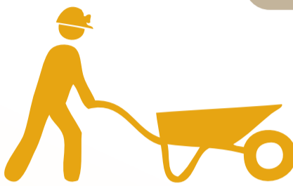
Những người làm việc ngoài trời