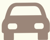
Xe ô tô